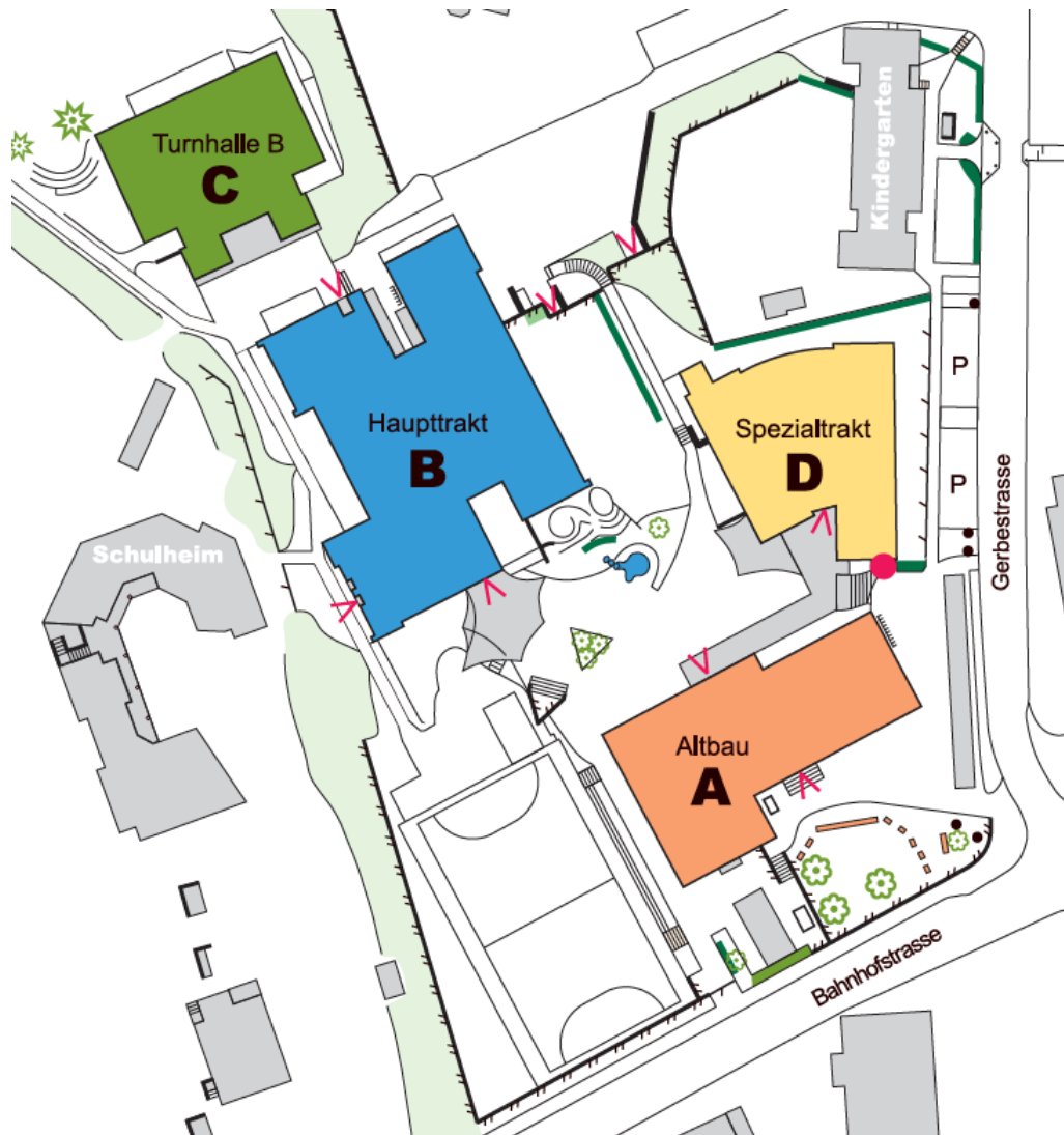
Situationsplan des Sekundarschulhauses Ritschberg in Elgg